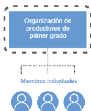
Gráfico 2: Auditoría de una ubicación