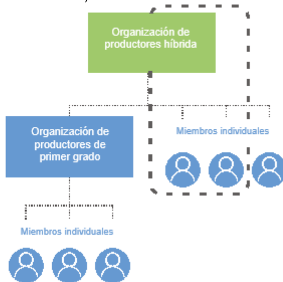
Gráfico 5: Opción 1 de auditoría multitramo