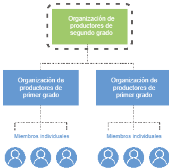
Gráfico 3: Opción 1