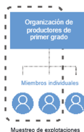
Gráfico 3: Auditoría multitramo