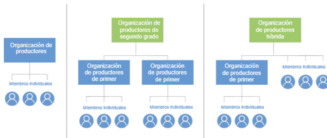
Gráfico 1: Organizaciones de productores

El gráfico que figura a continuación muestra dichas estructuras de una forma más visual: